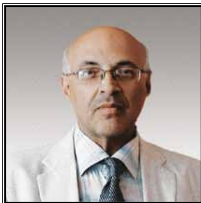
СОВЕТНИК ПРЕЗИДЕНТА РОССИЙСКОЙ АКАДЕМИИ ОБРАЗОВАНИЯ